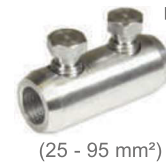
(25 - 95 mm 2 )