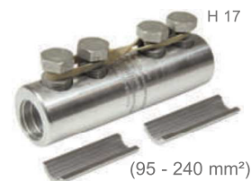
(95 - 240 mm 2 )