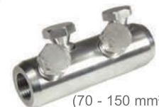
(70 - 150 mm 2 ) (120 - 240 mm 2 )