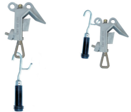
ajuste y montaje con adaptador GM-717