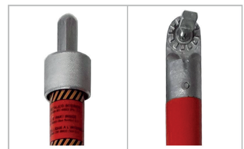
1- Acople hexagonal