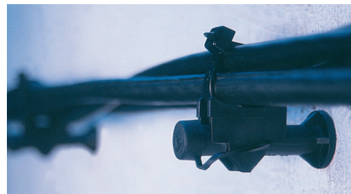
DPS25 Instalación con conductor de línea